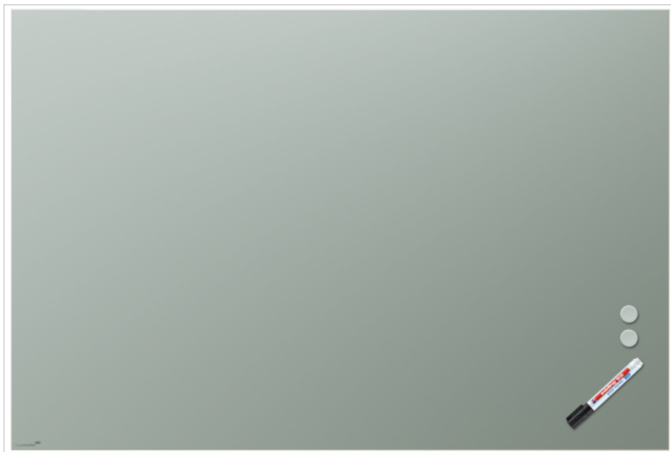
Tableau en verre mat 100x150cm sage green